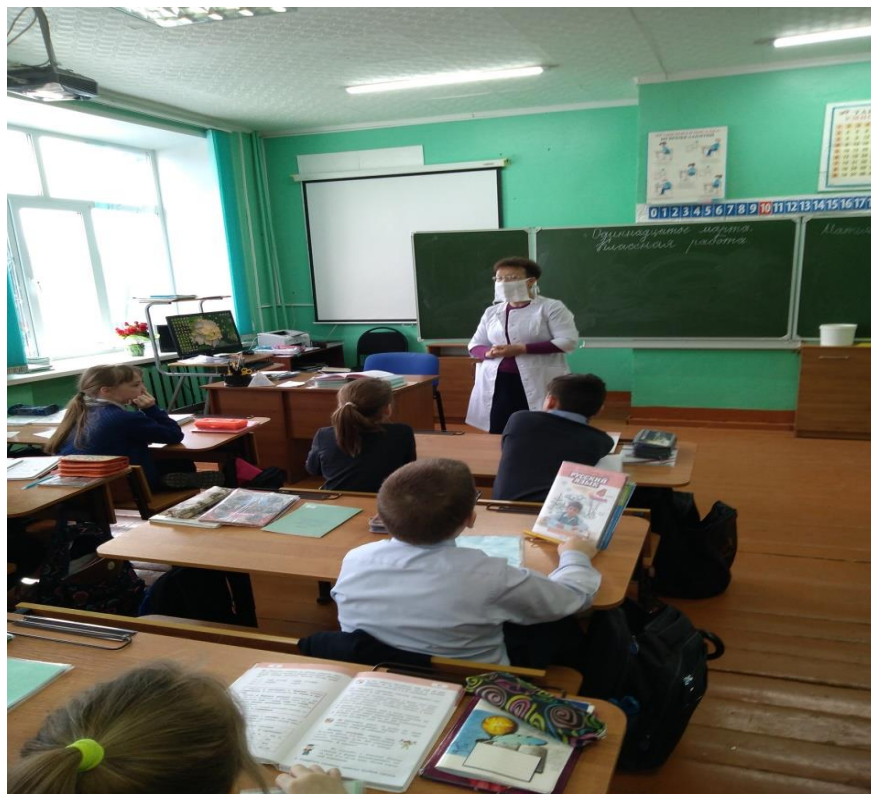
Тема: «Где найти витамины зимой и весной»